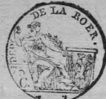
TABLE ALPHABÉTIQUE des Actes de naissances de la mairie d pour l'an dressé en exécution du décret im- périal du 20 juillet 1807.